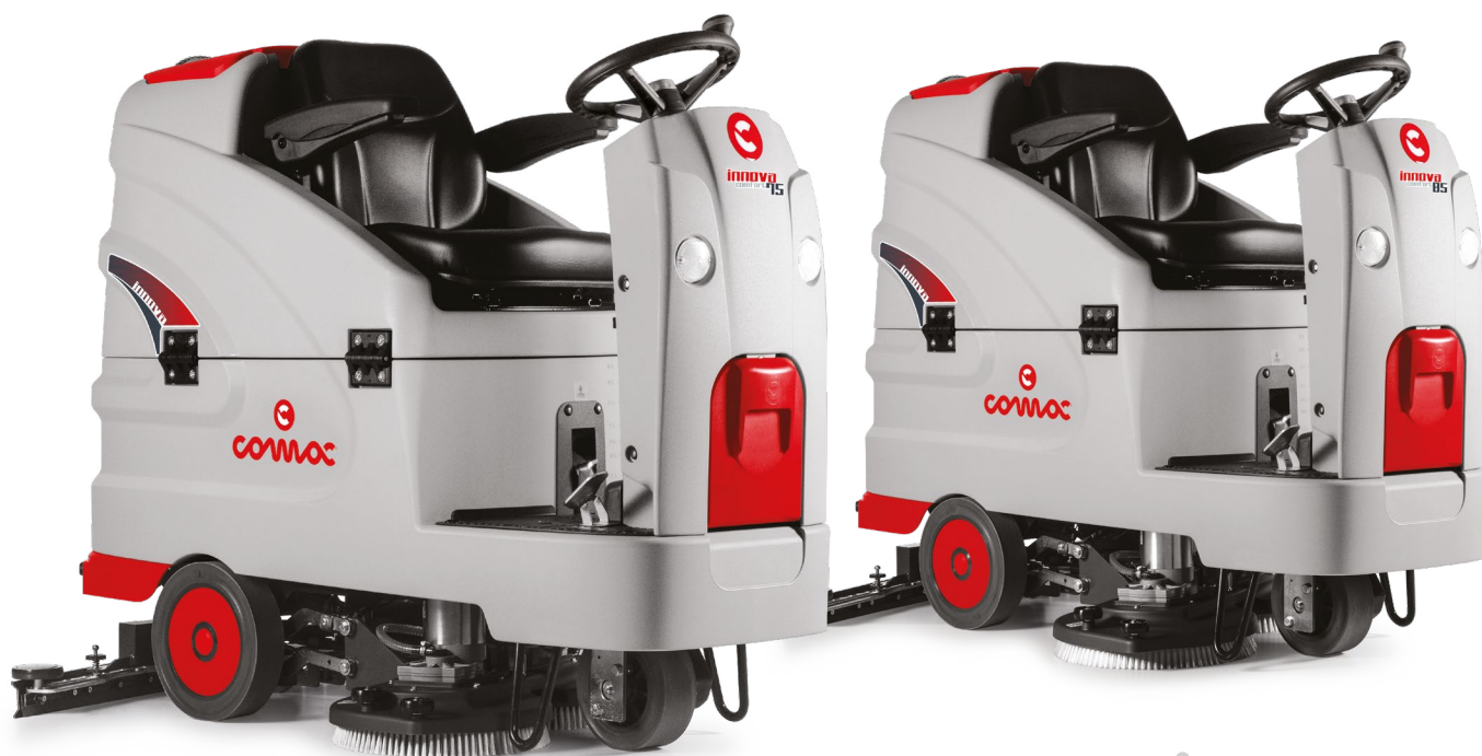
INNOVA COMFORT 75 B Két tányérkefés változat Munkaszélesség: 750 mm